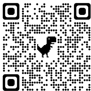
WEB 申込み QR コード