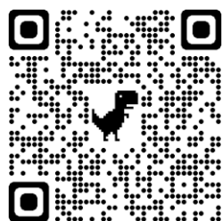
WEB 申込み QR コード