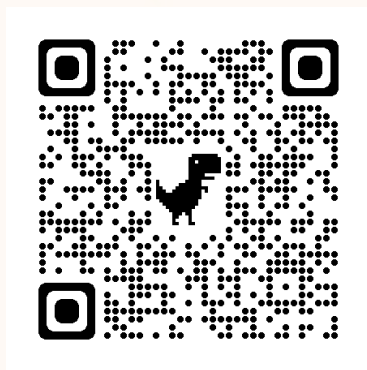
WEB 申込み QR コード